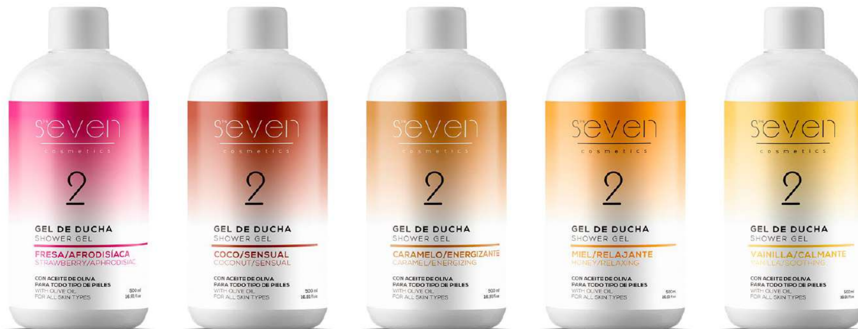
Ref. GELSEV.FR Fragola