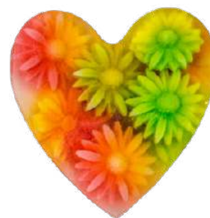
Ref: JC006 Lavanda.