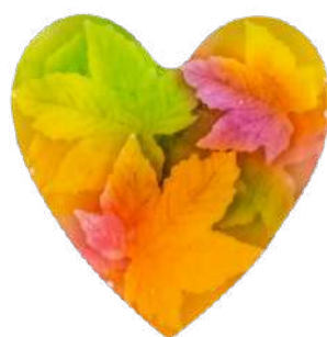
Ref: JC005 Kiwi.