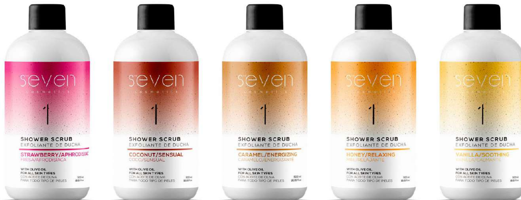
Ref. EXFSEV.FR Fragola