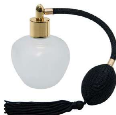
Ref. PP100MLM Profumatore mela. Ref. BPP100N Pompa profumatore pera nera.