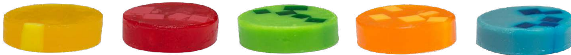
Ref: PSPC001 Calendula