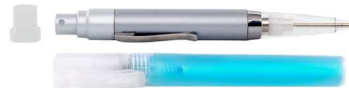
Ref. BOLI Colore: argento