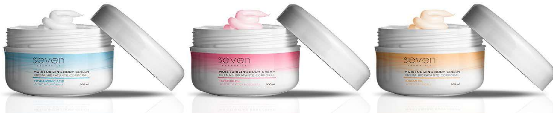
Ref. CREMA.ACH Crema idratante di acido ialuronico

L'acido ialuronico migliora la setosità e luminosità della pelle, correggendo i primi segni della vecchiaia cutanea.