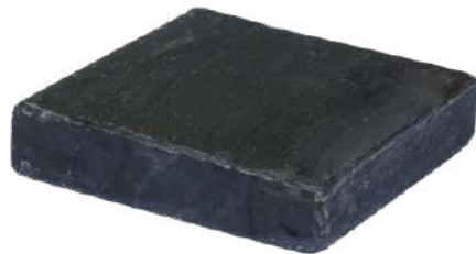
Ref: Ref: PSCA001 Sapone Solido di Carbone Attivo

Il carbone attivo è consigliato contro le infezioni della pelle, le punture di zanzare e insetti e la dermatite. Funziona come agente deodorante e, inoltre, contiene oli essenziali che potenziano le sue qualità.