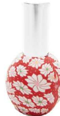
Ref. RETRO15ML.12 Rotondo