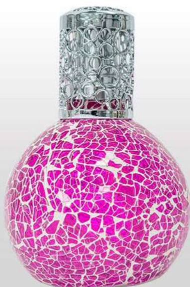
Ref. LCAT007 Colore: gres rosa