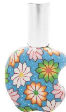
Ref. RETRO15ML.12 Mela