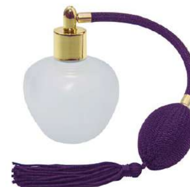
Ref. PP100MLM Profumatore mela. Ref. BPP100M Pompa profumatore pera viola.

*I diversi modelli di profumatori sono compatibili con tutti i colori delle pompe.