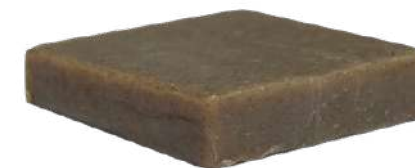
Ref: PSJA005 Antiparassiti

Il perfetto compagno per allontanare moscerini, mosche, pidocchi e altri parassiti. Grazie alla sua alta concentrazione di olio di neem, citronella e tea tree, questo sapone lascia sulla tua pelle uno strato cremoso che ostacola l'azione di questi parassiti. Si può usare su viso, mani, corpo e capelli.