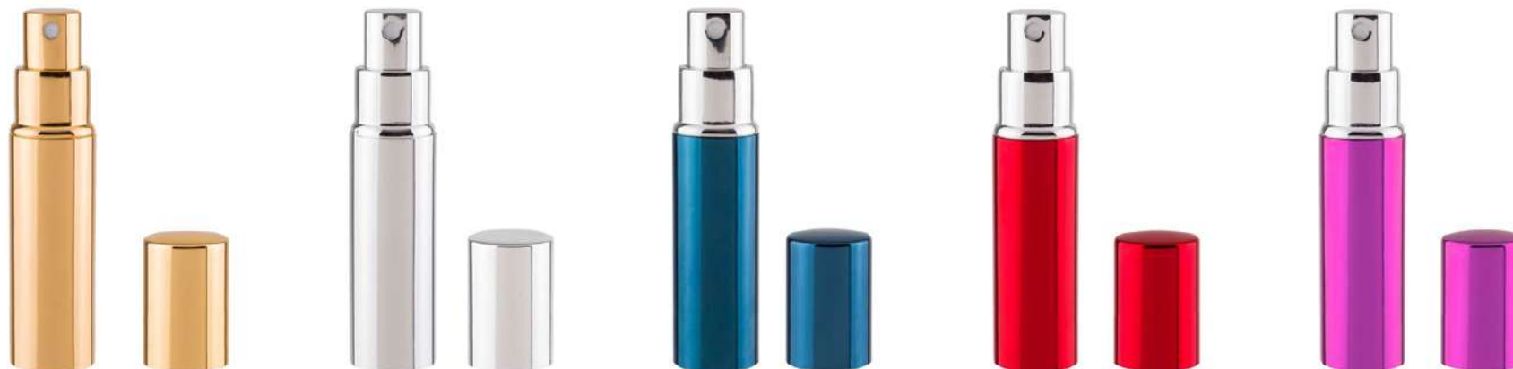
Ref. PO8ML Colore: oro