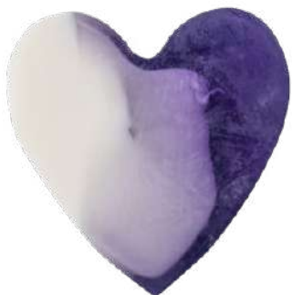
Ref: JC001 Arándanos.