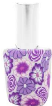
Ref. RETRO15ML.10 Viola