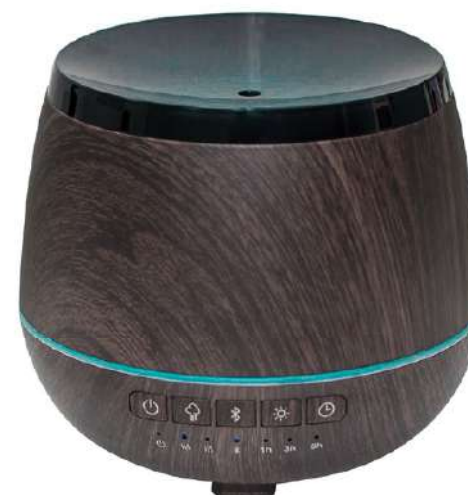
Ref. BLU200B Colore: legno scuro

Lampada multicolore. Luce ecologica. Connessione elettrica. Timer 60, 90 e 120 minuti.