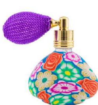
Ref. FR15ML Colore: vario