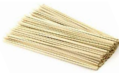
Ref. VARNAT BASTONCINI TAGLIATI NATURALI