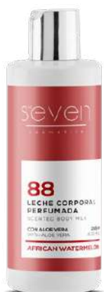
Ref. CP16.200 African watermelon.