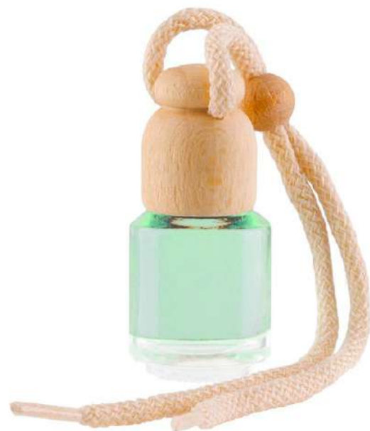
Ref. CAR7ML Colore: trasparente