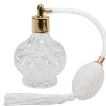
Ref. PP100MLL Profumatore lampada. Ref. BPP100B Pompa profumatore pera bianca.