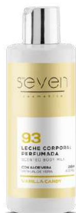
Ref. CP12.200 Vanilla candy.