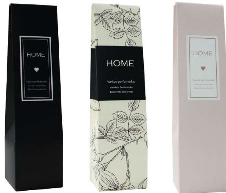
Ref. ESTM006 Home nero Ref. ESTM007 Home stampa Ref. ESTM007 Home rosa