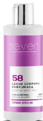
Ref. CP10.200 Greek orchid.