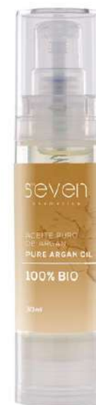
Ref. AAR.30 Olio d'argan

La rosa canina possiede numerosi benefici per la pelle: ritarda i segni della vecchiaia prematura e le rughe, migliora le smagliature e le macchie della pelle, combatte gli effetti del fotoinvecchiamento e reidrata la pelle secca. Inoltre, diminuisce le cicatrici chirurgiche e accidentali, migliora la rigenerazione della pelle in caso di bruciature, rinforza il sistema immunologico e stimola la circolazione.