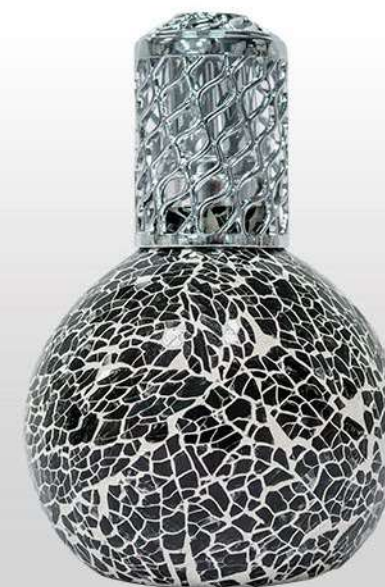
Ref. LCAT009 Colore: gres nero

Una lampada catalitica è un diffusore che, oltre a profumare in modo duraturo e omogeneo, purifica tutta la casa. Le sue proprietà collaborano con il benessere quotidiano, creando un ambiente creativo, piacevole e sano.