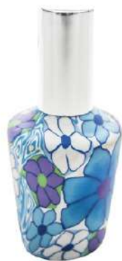
Ref. RETRO15ML.09 Azzurro