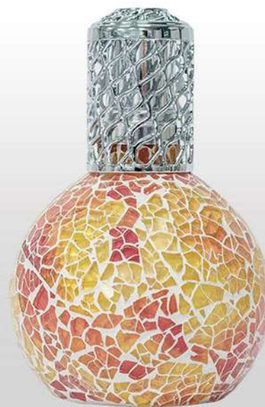
Ref. LCAT008 Colore: gres caldo