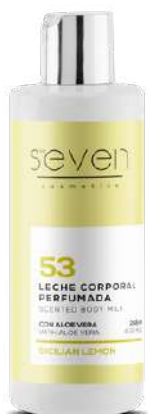
Ref. CP09.200 Sicilian Lemon.