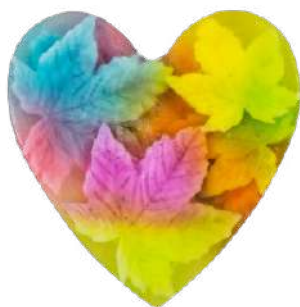
Ref: JC004 Melón.