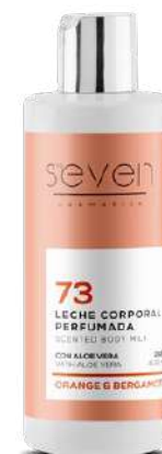
Ref. CP15.200 Orange & bergamot.