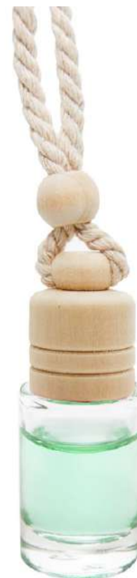
Ref. CAR6.5ML Colore: trasparente