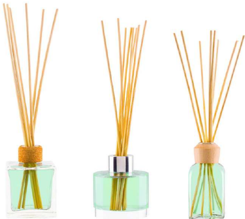
Ref. MC100OBTUAROM Colore: trasparente Ref. MR100OBTUAROC Colore: trasparente Ref. MF100MLOBTUAROMD Colore: trasparente

Include bastoncini, otturatore e anello di sughero. Include bastoncini, otturatore e anello metallico. Include bastoncini, otturatore e anello di legno.