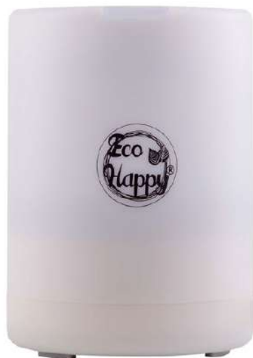
Ref. BRU300 Colore: bianco

Lampada multicolore. Luce ecologica. Connessione elettrica. Timer 60, 90 e 120 minuti.