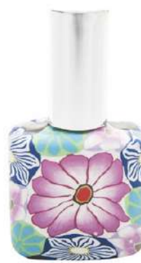
Ref. RETRO15ML.11 Quadrato