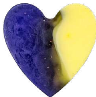
Ref: JC002 Noche de verano.