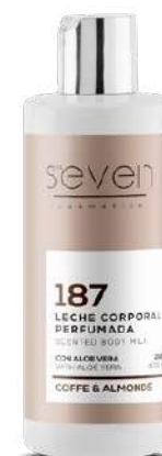
Ref. CP17.200 Coffe & almonds.