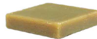
Ref: PSJA001 Aloè Vera

L'aloè è un eccellente filtro solare e un antibiotico naturale. Si consiglia per pelli con problemi di acne, eczemi, irritazioni, macchie, bruciature e pelli invecchiate.