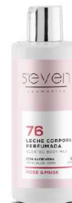
Ref. CP11.200 Rose & musk.