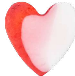
Ref: JC003 Granada.