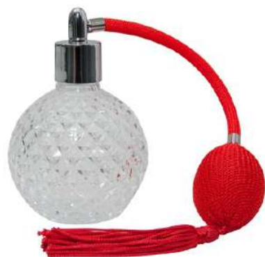
Ref. PP100MLC Profumatore palla. Ref. BPP100R Pompa profumatore pera rossa.