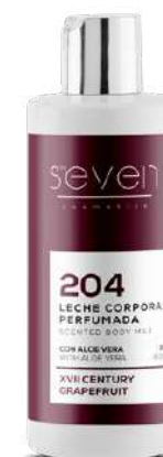
Ref. CP13.200 XVII century grapefruit.

Crema corporale arricchita con aloè vera. Leggera e di rapido assorbimento, idrata la pelle lasciandola suave e profumata. La sua consistenza vellutata e leggera facilita la sua applicazione.