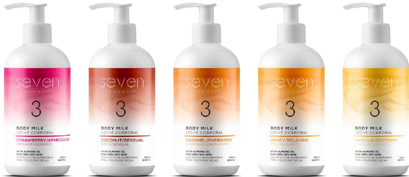
Ref. BMSEV.FR Fragola