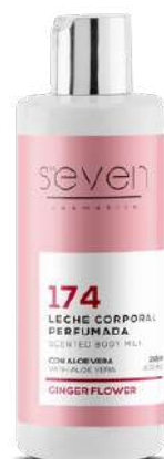
Ref. CP18.200 Ginger flower.