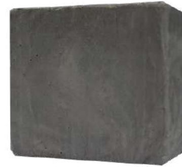
Ref: PSJMA001 Alghie Marine - Anticellulite

Detergente viso e corpo per ogni tipo di pelle. Purificante cellulare. Con una base di sapone di glicerina, con olio extra vergine d'oliva, argilla e alghe marine. Abbiamo creato un sapone che all'applicarlo genera una pellicola molto fine che attua in modo di maschera viso. Contribuisce alla rigenerazione cellulare. Si consiglia lasciar attuare durante qualche minuto prima di risciacquare. Dona alla nostra pelle le proprietà antibatteriche e purificanti dell'argilla che, inoltre, pulisce in profondità e produce un effetto rilassante. Fornisce elasticità e sensazione di freschezza.