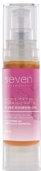
Ref. ARM.30 Olio di rosa canina.

La rosa canina possiede numerosi benefici per la pelle: ritarda i segni della vecchiaia prematura e le rughe, migliora le smagliature e le macchie della pelle, combatte gli effetti del fotoinvecchiamento e reidrata la pelle secca. Inoltre, diminuisce le cicatrici chirurgiche e accidentali, migliora la rigenerazione della pelle in caso di bruciature, rinforza il sistema immunologico e stimola la circolazione.