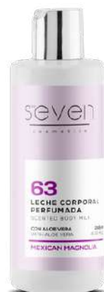
Ref. CP14.200 Mexican magnolia.