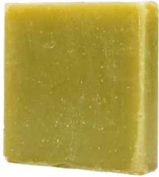
Ref: PSJE001 Exaleno Oliva Eco - Antivecchiaia

IDEALE PER PELLI ATOPICHE. Per viso, mani e corpo. Questo sapone contiene oli essenziali, estratti e oli di prima pressione al freddo. Nella sua composizione predomina l'olio extra vergine d'oliva ECOLOGICO che, insieme all'olio di cocco, ricino e mandorla dolce, tra altri, fa che sia fortemente idratante ed emolliente. Alla sua formula si aggiunge un componente naturale con le stesse proprietà dermatologiche dell'acido ialuronico.